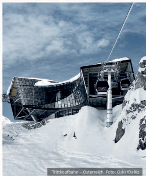
Trittkopfbahn – Österreich