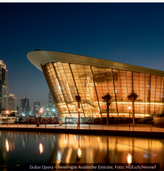
Dubai Opera – Vereinigte Arabische Emirate